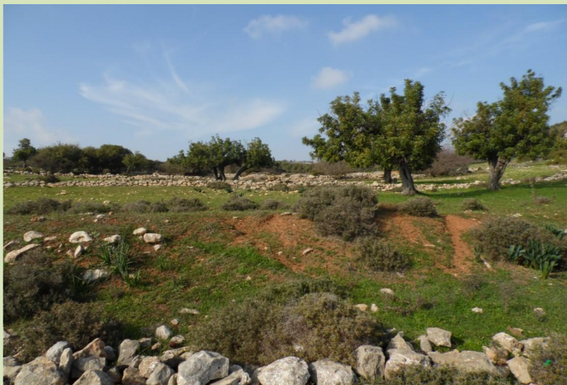
AgroLIFE High Nature Value (HNV) carob groves in Anogyra village, Limassol Καλλιέργειες χαρουπιών Υψηλής Φυσικής Αξίας (ΥΦΑ), Ανόγυρα, Λεμεσός