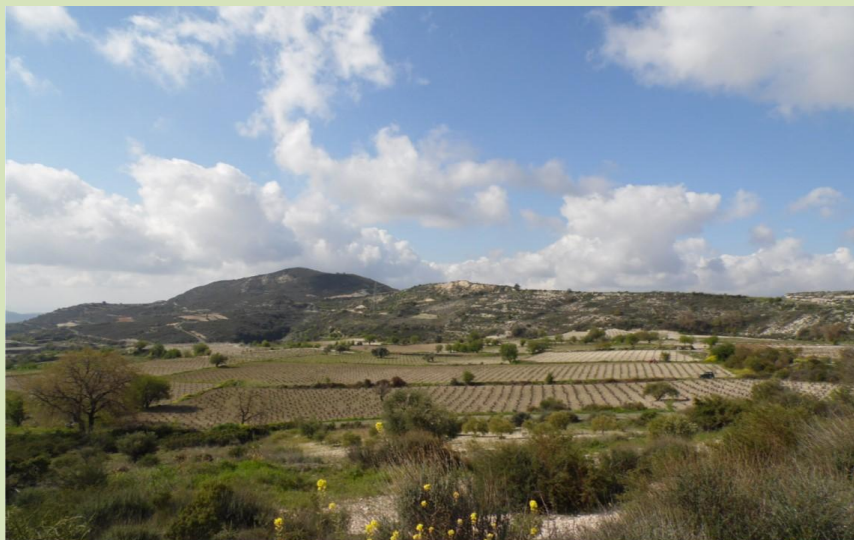
AgroLIFE High Nature Value (HNV) vineyards in Lania and Kapilio villages, Limassol Αμπελώνες Υψηλής Φυσικής Αξίας (ΥΦΑ) στα χωριά Λάνεια και Καπηλειό

Οι ΑΠΥΦΑ αποτελούν μεγάλο τμήμα της φυσικής και πολιτιστικής μας κληρονομιάς, παρέχοντας σημαντικές υπηρεσίες οικοσυστήματος και υποστηρίζοντας πληθώρα ειδών χλωρίδας και πανίδας. Στόχος του AgroLIFE είναι η διατήρηση και η ανάδειξη ιστορικών ΑΠΥΦΑ, με έμφαση στις παραδοσιακές καλλιέργειες της αμπέλου στην περιοχή Λάνειας και Καπηλειού και της χαρουπιιάς στην περιοχή της Ανώγυρας.